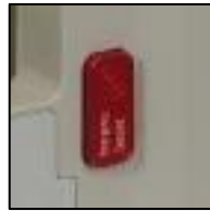
Clutch release button for constant speed descent