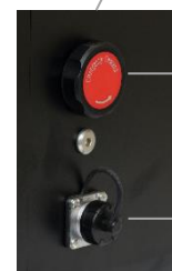
Clutch release button for constant speed descent